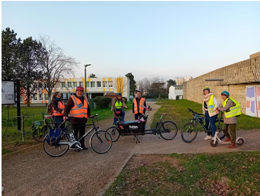
Participation à la mobilisation des centres sociaux du 30 janvier 2024