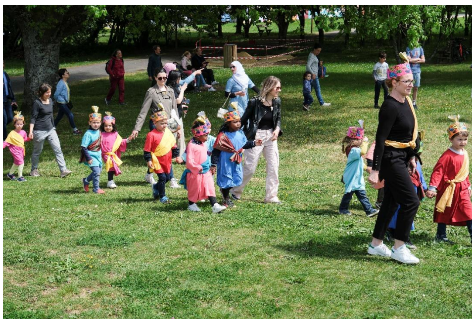
Giboul'dingues Bollywood 2023