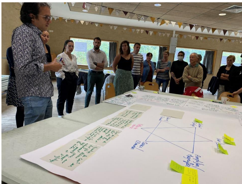
1 ère séance de pilotage/ évaluation des 4 cercles

2 matinées ont eu lieu depuis le lancement du nouveau projet les 14 octobre 2023 et 30 mars 2024.