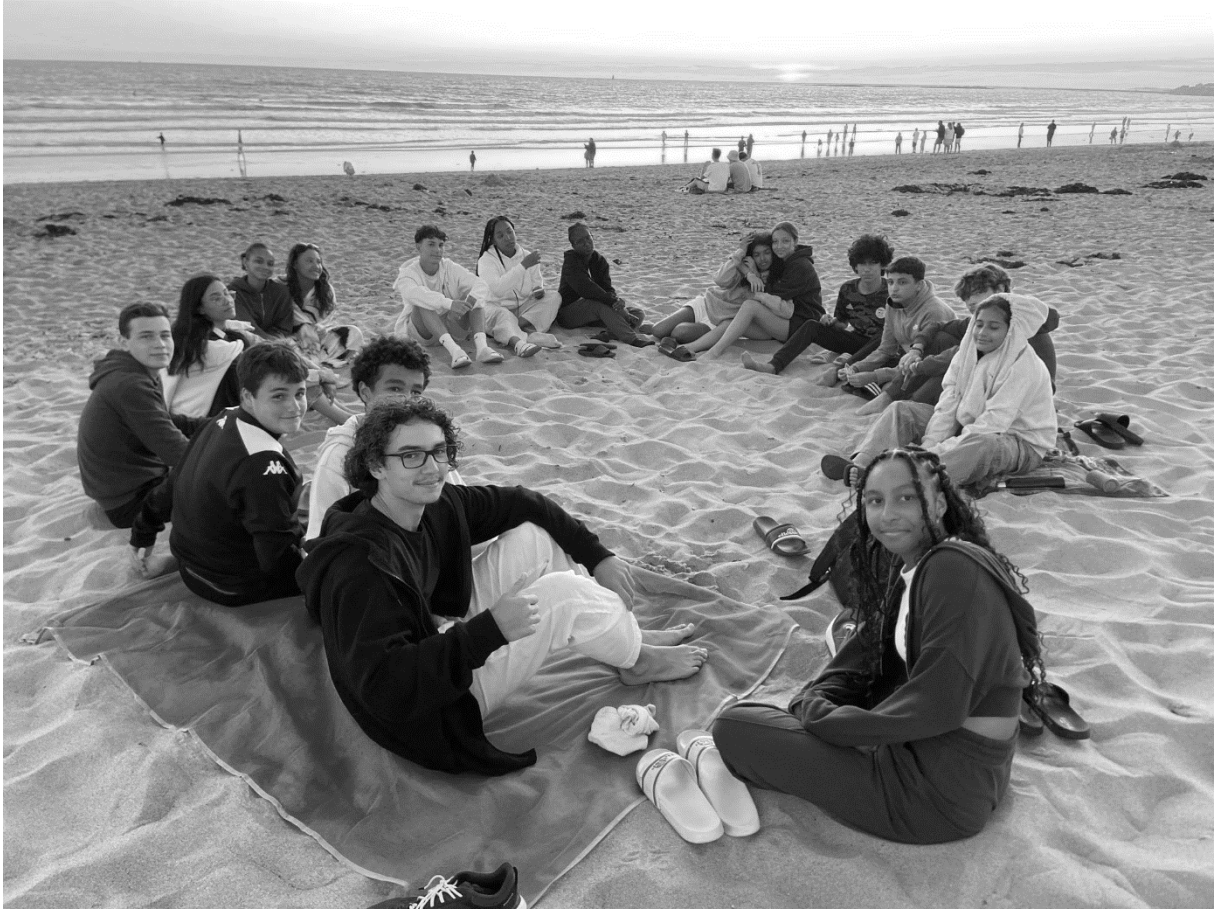
Séjour à Brem-sur-Mer