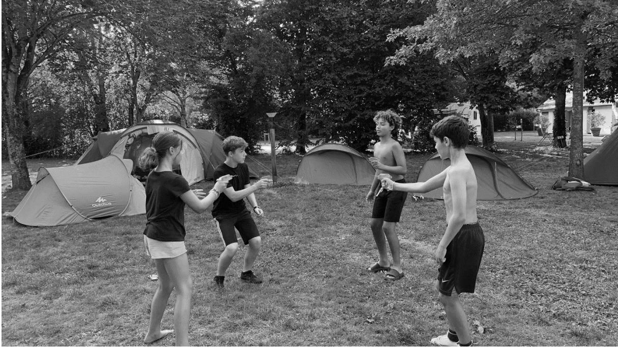
Séjour à Chinon

Mercredis : Patinoire, grand jeux, Médiation animale, Cuisine, Piscine, Accrobranche, jeux de société, cleanwalk, Olympiades avec le secteur BV, Débat sur les réseaux sociaux avec les étudiants., spectacle au TAP