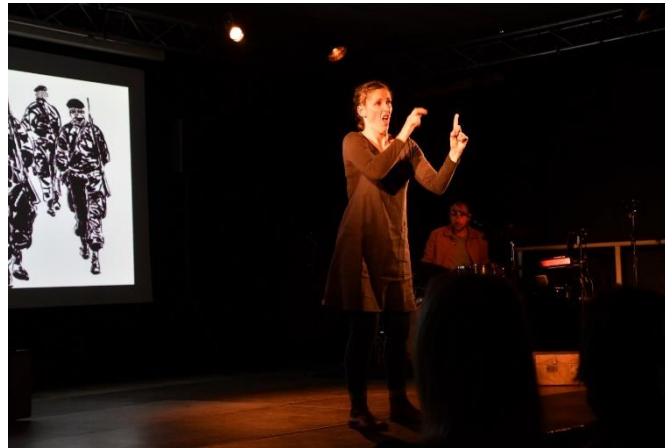
Parlons d'Algérie Mars 2023