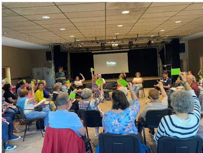
Assemblée Générale Mai 2023

Le Conseil d'Administration est constitué de 12 adhérents élus, d'un membre de droit représentant de la Fédération d'affiliation et d'un membre invité élu de la Ville de Poitiers. Sa fonction consiste à décider des grandes orientations de l'Association en matière de politique associative, gestion financière et salariale. Il s'est réuni 5 fois.