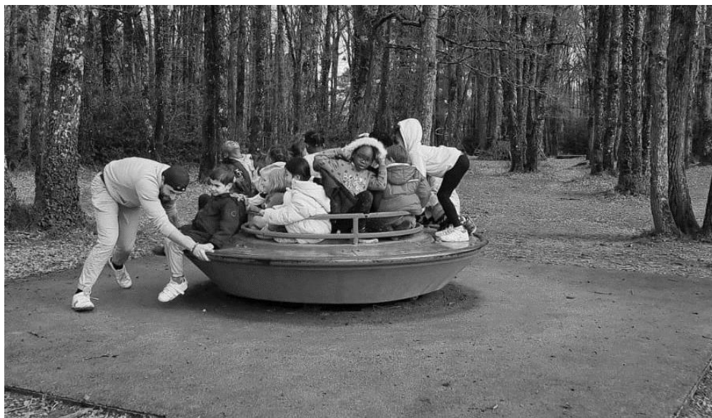
Sortie nature à l'accueil de loisirs

fabrication de nids d'oiseau/ parcours vélo/boite sensorielle/ spectacle/ plantation/ lecture UNICEF/ plantation/ patinoire/ activité EHPAD/ activité autour des droits de la femme/ médiathèque