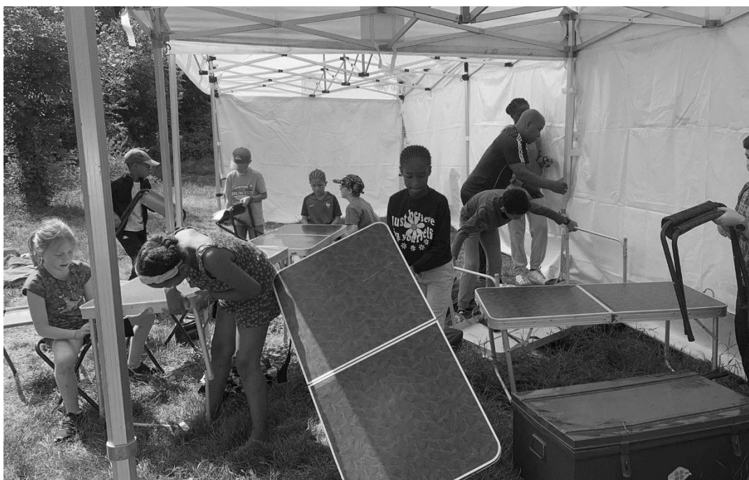
Séjours dans le marais Poitevin