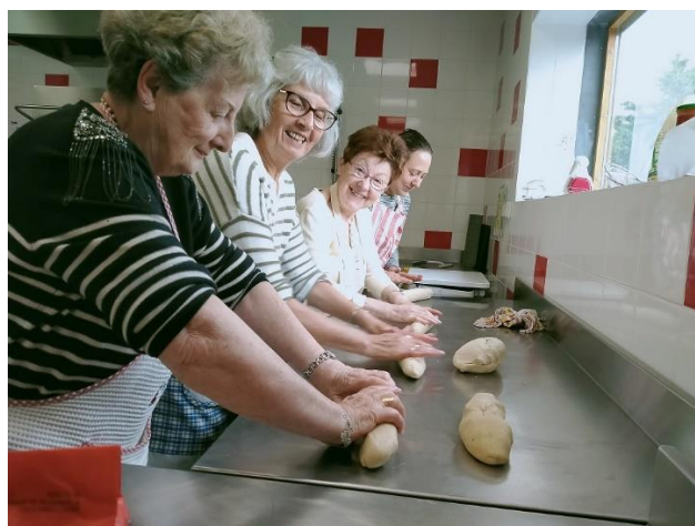
Atelier Bien vieillir